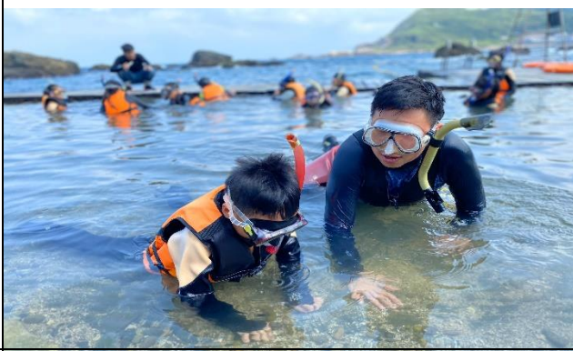
認識浮潛裝備並指導學員穿著浮潛裝備。