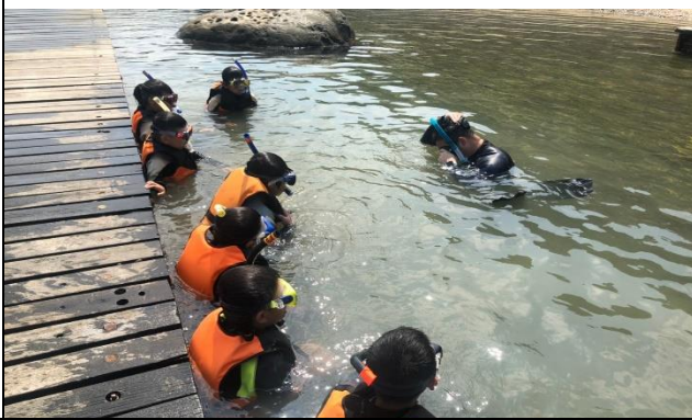
教練複習裝備穿戴方法，總結課堂浮潛注意