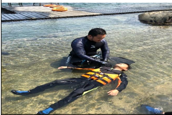
學習基本水中安全認知及自救能力：漂浮